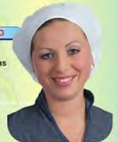
GORRO DACRON TIPO BAÑO