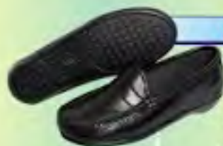
ZAPATO DAMA REF: FRESITA