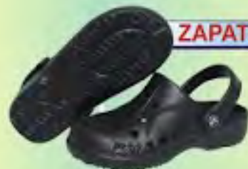
ZAPATO EVACOL REF: 063