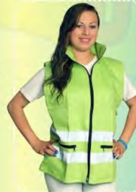
CHALECO IDU INGENIERO