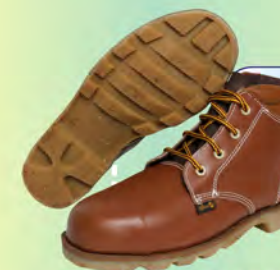
ALPACA MONTERO LINIERO