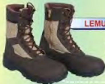
LEMUS TIPO MILITAR - CON LONA