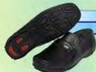
ZAPATO CABALLERO TIPO MOCASIN