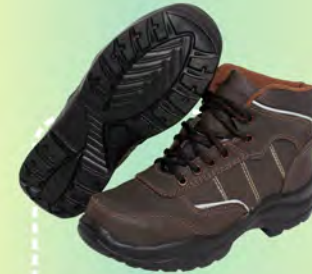
LEMUS TIPO TENIS