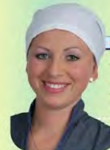
GORRO DACRON TIPO BAÑO