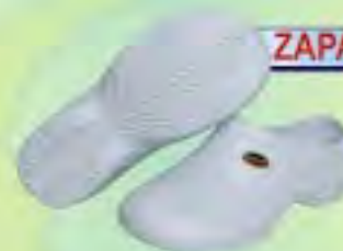
ZAPATO EVACOL REF: 015