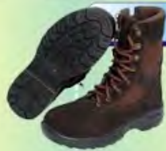
LEMUS TIPO MILITAR CON LONA