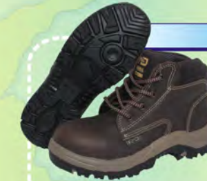
ALPACA PLUMA PU-PU