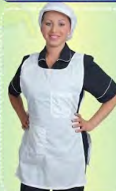
MICO O ESCAPULARIO EN DACRON