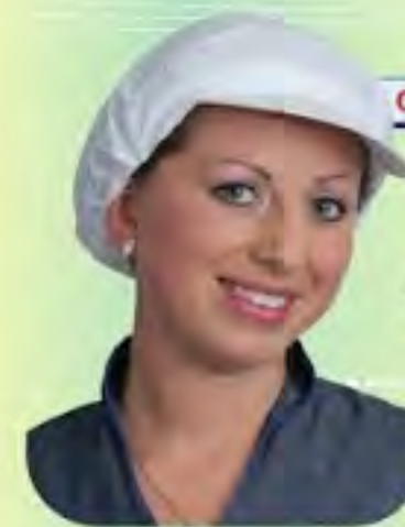
GORRO VISERA EN DACRON

TODO LO RELACIONADO CON SEGURIDAD INDUSTRIAL