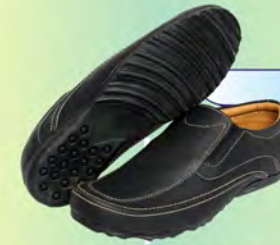
ZAPATO CABALLERO - SPORT