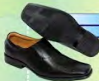
ZAPATO CABALLERO FORMAL