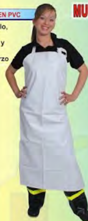
CONJUNTO ANTIFLUIDO CON VIVOS