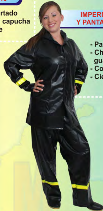
IMPERMEABLE CHAQUETA Y PANTALÓN CALIBRE 18 Y 22