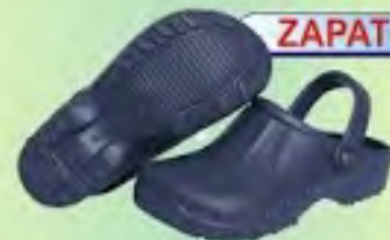
ZAPATO EVACOL REF: 066