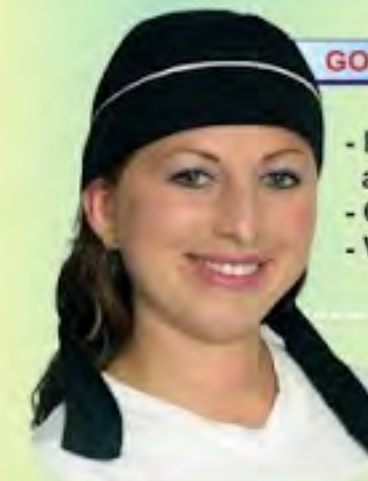
GORRO TIPO PIRATA