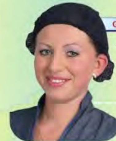
GORRO MALLA TIPO BAÑO