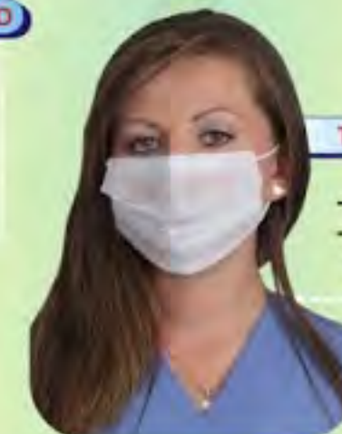
TAPABOCAS TIPO MEDICO