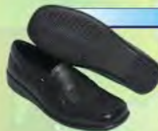
ZAPATO DAMA REF: 031