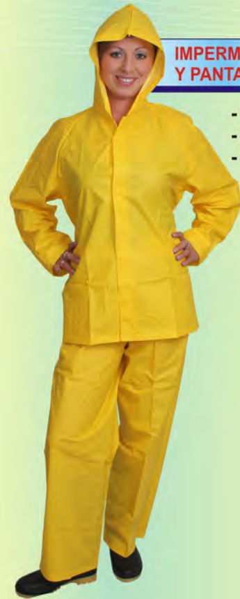
IMPERMEABLE CHAQUETA Y PANTALÓN CALIBRE 16