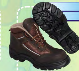
LEMUS TIPO TENIS CON MALLA