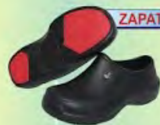
ZAPATO EVACOL REF: 080