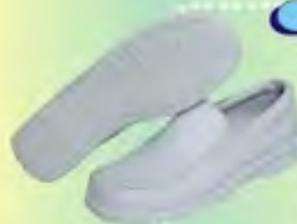
ZAPATO DAMA REF: 028